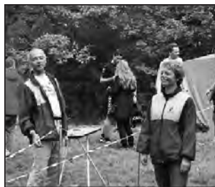
Officials i arbejde ved Jonstrup Vang Løbet