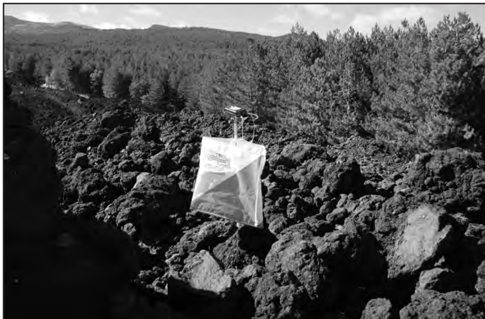
Spektakulær postplacering til D 50'erne – På toppen af en størknet lavastrøm fra 2002-udbruddet, der i et 200 m bredt bælte slangede sig gennem skoven og havde jævnet alt under sig. 25 m oppe på den gølge lava-ås sad posten.